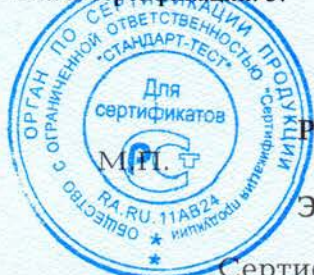
Схема сертификации: 3.

ДОПОЛНИТЕЛЬНАЯ ИНФОРМАЦИЯ Инспекционный контроль: ноябрь 2017г., ноябрь 2018г.